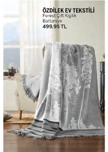
ÖZDİLEK EV TEKSTİLİ Forest Çift Kişilik Battaniye 499,95 TL