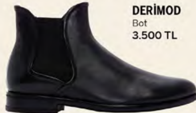
DERİMOD Bot 3.500 TL