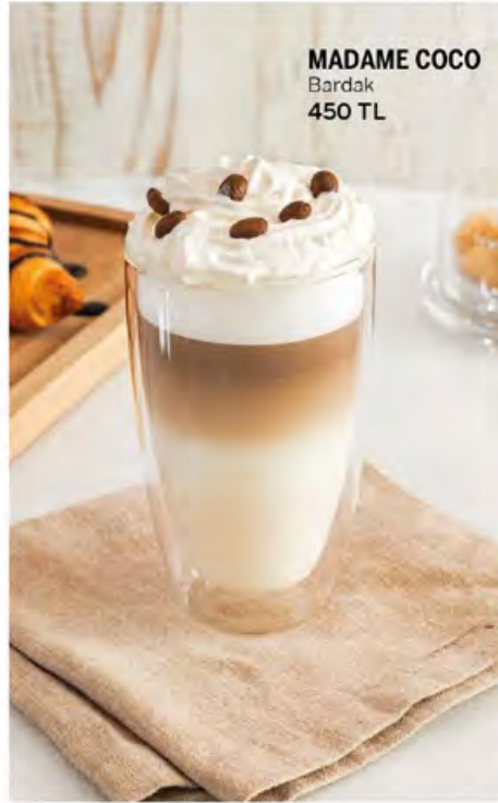
MADAME COCO Bardak 450 TL

Kış aylarının büyüleyici güzelliğini ortaya çıkaran kar beyazlığı ve doğal dokular... Mevsimin göz alıcı desenlerinin işlendiği tasarımlar, ahşap ve siyahın buluşmasıyla modern bir hava yaratıyor. Her bir köşede doğallığı hissedebileceğiniz dekorasyon ürünleriyle kış güzelliğini evinize taşımaya hazırlanın!