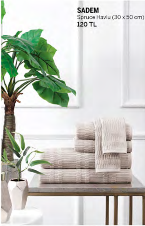
SADEM Spruce Havlu (30 x 50 cm) 120 TL