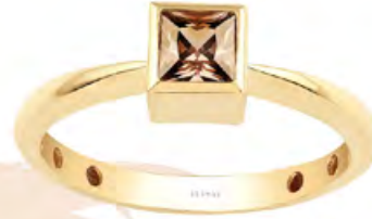
ATASAY Yüzük 5.345 TL