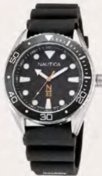
NAUTICA Saat 2.599 TL