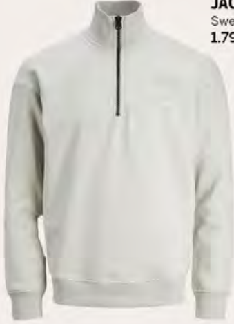
JACK & JONES Sweatshirt 1.799,99 TL

Yılın en romantik günleri gelmişken sevgilinizin yüzünde tatlı bir tebessüm oluşturacak hediye seçeneklerini sizler için hazırladık. Sevgi kadar yumuşak tonlar, hoş kokular, sıcacık kazaklar ve aksesuarlar... En uyumlu çiftlerin tercihi olacak eşsiz parçalar, Özdelekteyim’de keşfedilmeyi bekliyor.