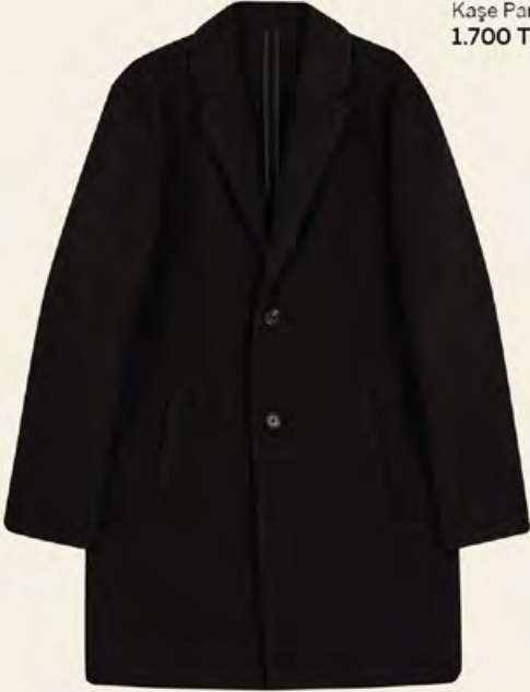
DEFACTO Kaşe Parka 1.700 TL