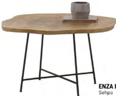
ENZA HOME Sehpa 5.185 TL