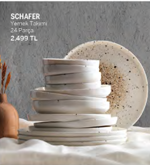
SCHAFER Yemek Takımı 24 Parça 2.499 TL