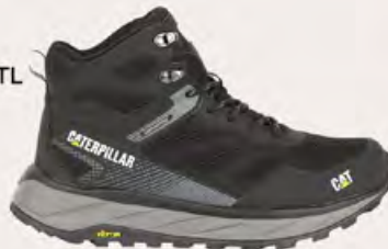
CAT Bot 4.199 TL