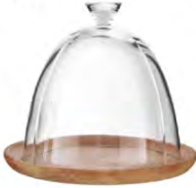
PAŞABAHÇE Servis Tabağı 1.300 TL