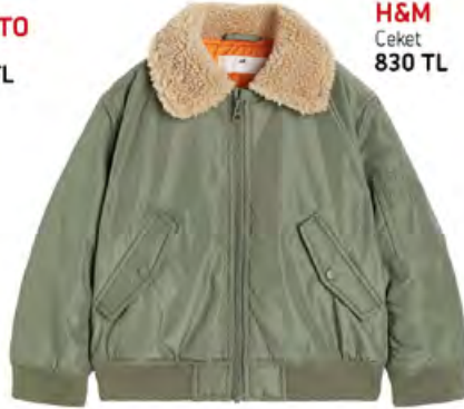
H&M Ceket 830 TL