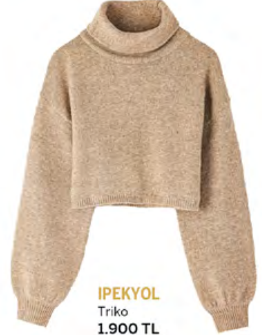
IPEKYOL Triko 1.900 TL