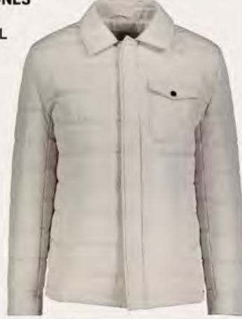
FINESUITS Mont 1.299,99 TL