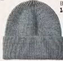
KOTON Bere 149,99 TL