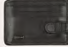
CENGİZ PAKEL Cüzdan 699,99 TL