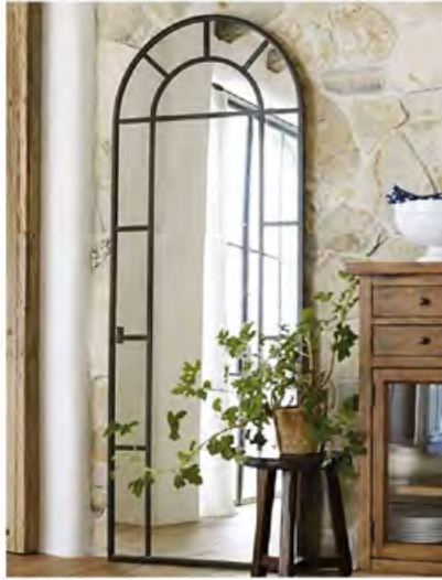
KOÇTAŞ Ayna 14.299 TL