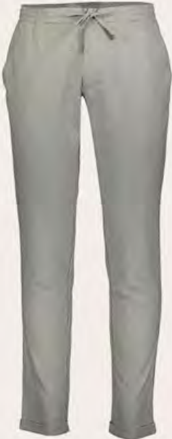
SÜVARI Pantolon 431,99 TL