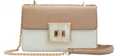
ALDO Çanta 3.600 TL