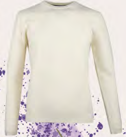
GUESS Triko 3.280 TL