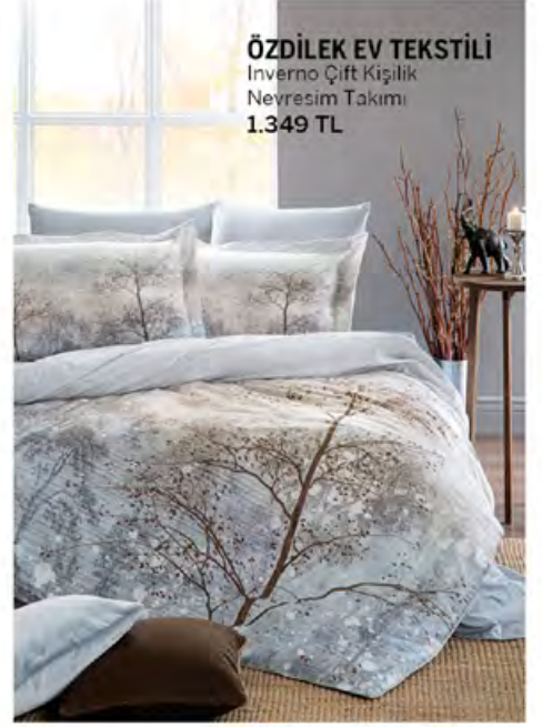
ÖZDİLEK EV TEKSTİLİ Inverno Çift Kişilik Nevresim Takımı 1.349 TL