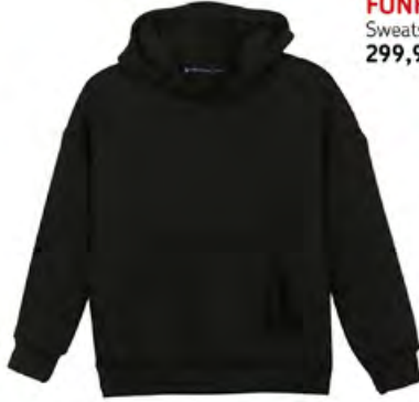
FUNFAIR Sweatshirt 299,99 TL