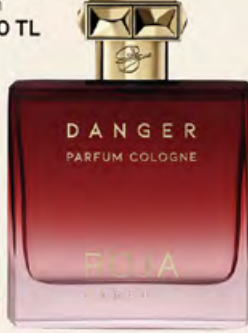
ROJA PARFUMS Parfüm 10.000 TL