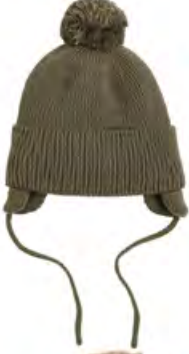
H&M Bere 280 TL