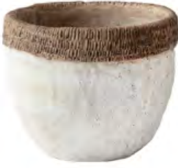
MADAME COCO Saksı 1.700 TL