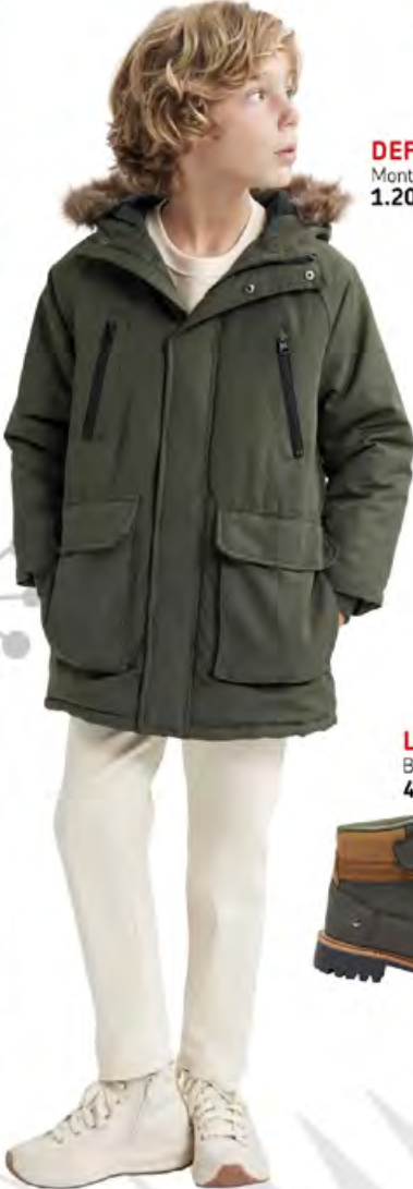
DEFACTO Mont 1.200 TL