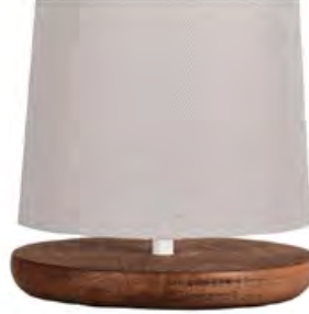
KOÇTAŞ Abajur 299 TL