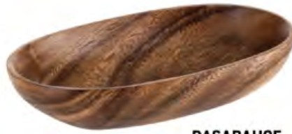
PAŞABAHÇE Ahşap Servis Tabakası 90 TL