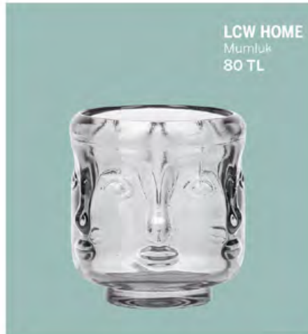
LCW HOME Mumluk 80 TL