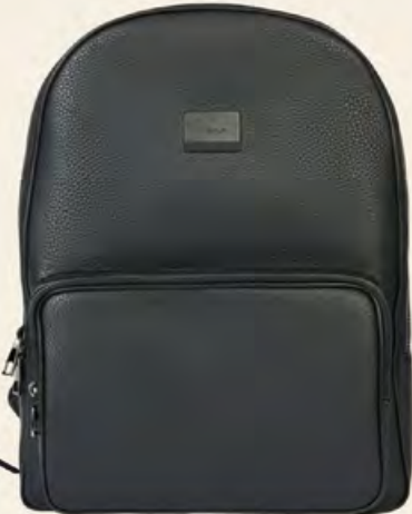
AVVA Çanta 1.725 TL