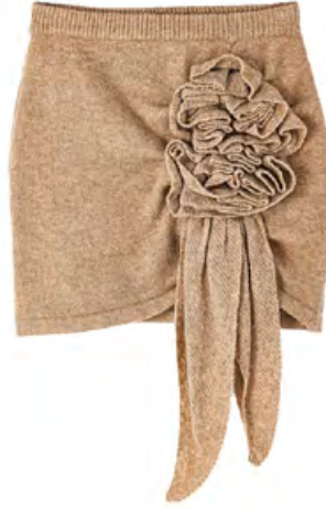
IPEKYOL Etek 1.900 TL