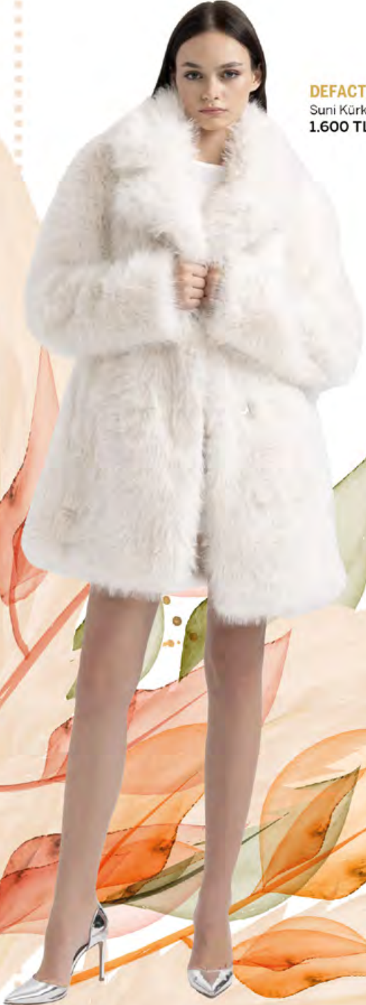
DEFACTO Suni Kürk 1.600 TL