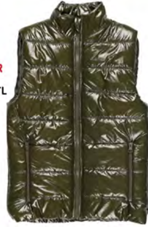
FUNFAIR Yelek 249,99 TL