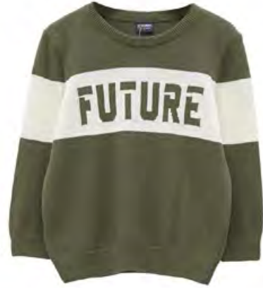
LCW Triko 230 TL